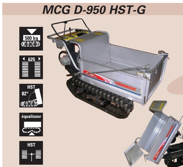
MCG D-950 HST-G