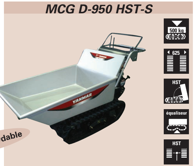
MCG D-950 HST-S

La fonction benne hydraulique rend le déchargement extrêmement facile.